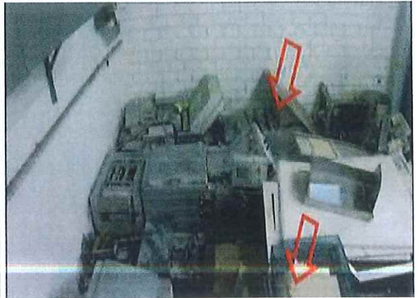
รายการที่ 3 เครื่อง Roll System (Pre&Post) ยี่ห้อ Hunkeler