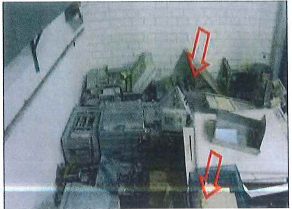
รายการที่ 3 เครื่อง Roll System (Pre&Post) ยี่ห้อ Hunkeler